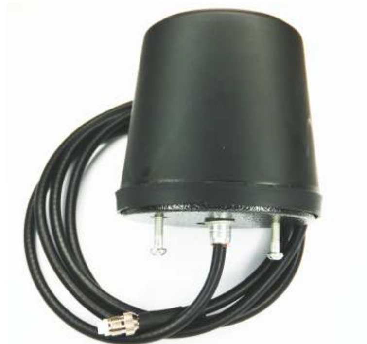
Рис.1 Внешний вид антенны PROFI 3 Band

Внимание! Во избежание выхода из строя модуля передачи данных не допускается его включение при отключенной штатной антенне и не подключенной антенне PROFI 3 Band (даже при подключенном адаптере).